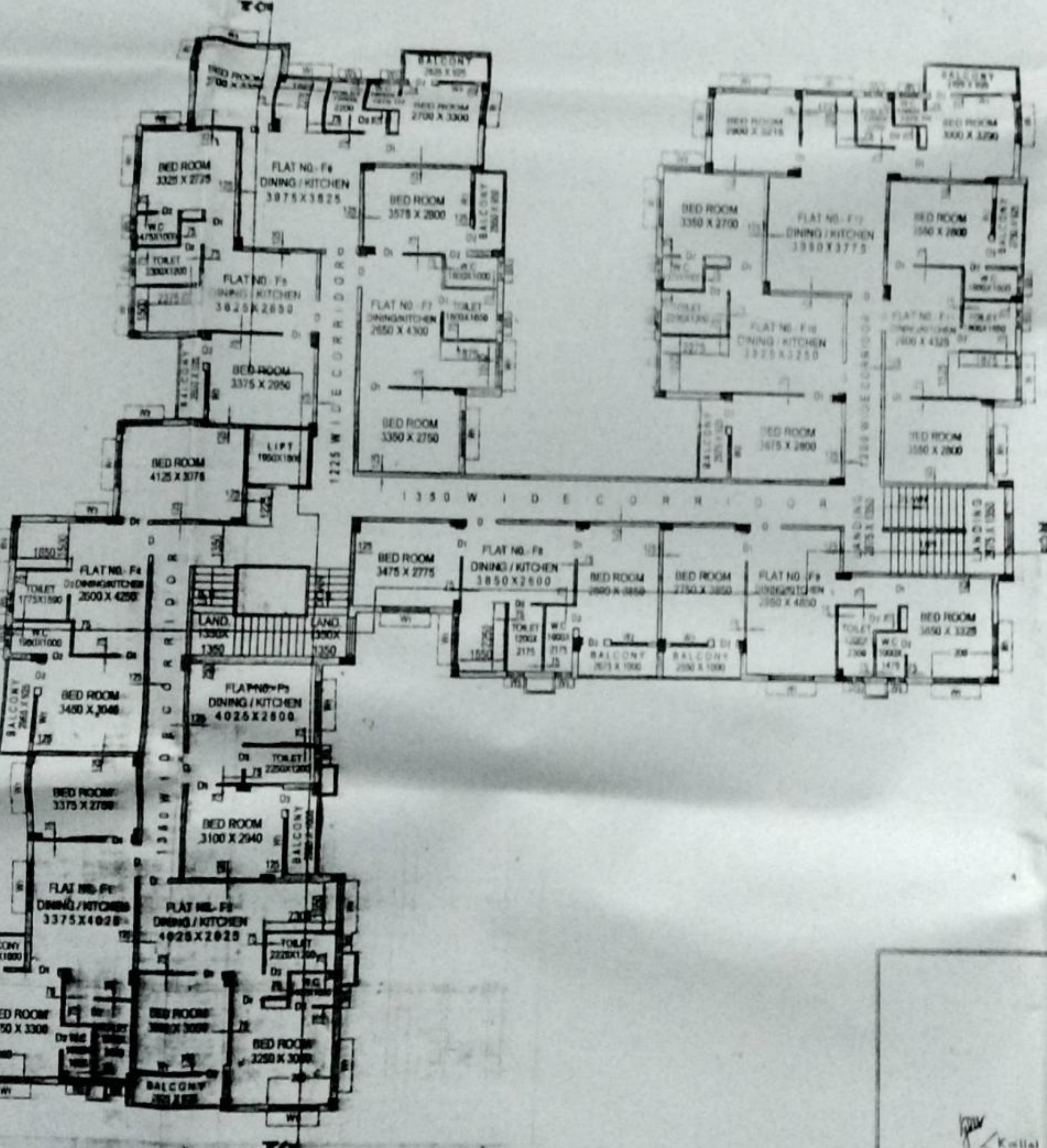
TYPICAL FLOOR PLAN