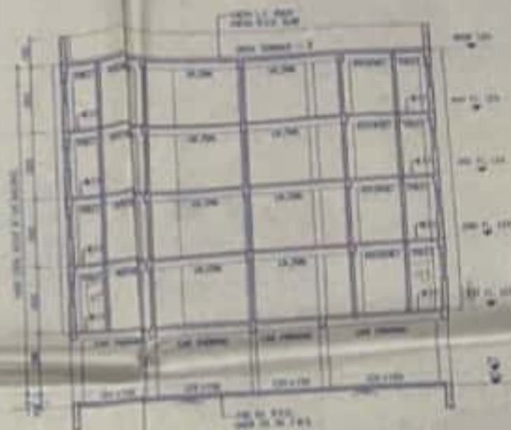
SECTION AT - DD