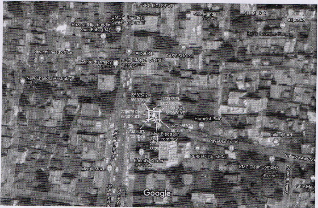
20 m

PREMISES NO.- 79A,ALIPORE ROAD KOL- 700 027, WARD- 82, BOROUGH-IX.P.S - CHETLA