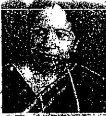
দক্ষী দক্ষী দক্ষী