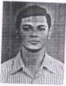
SHIV NIKETAN PVT. LTD.